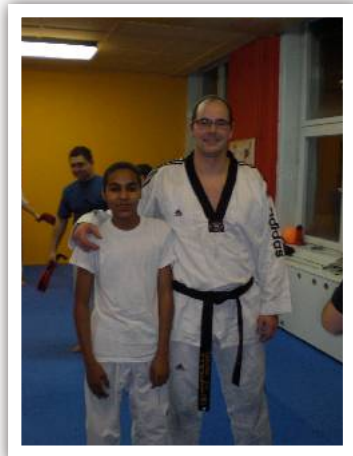
Groß und Klein