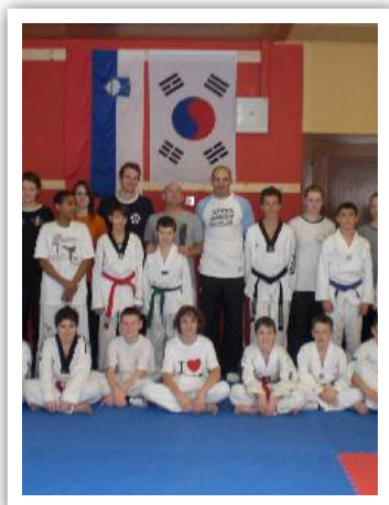
Nach dem Training