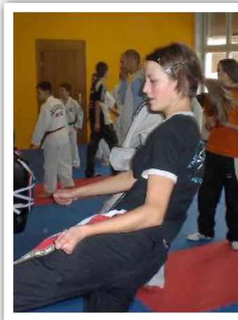
Meli beim Training